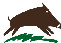
Parco Regionale della Maremma

ALTRI APPUNTAMENTI: Il 23 ottobre 2010 alle 17 nell'ex cinema di Alberese si terrà la premiazione della seconda edizione del concorso fotografico "Camminando nel parco"